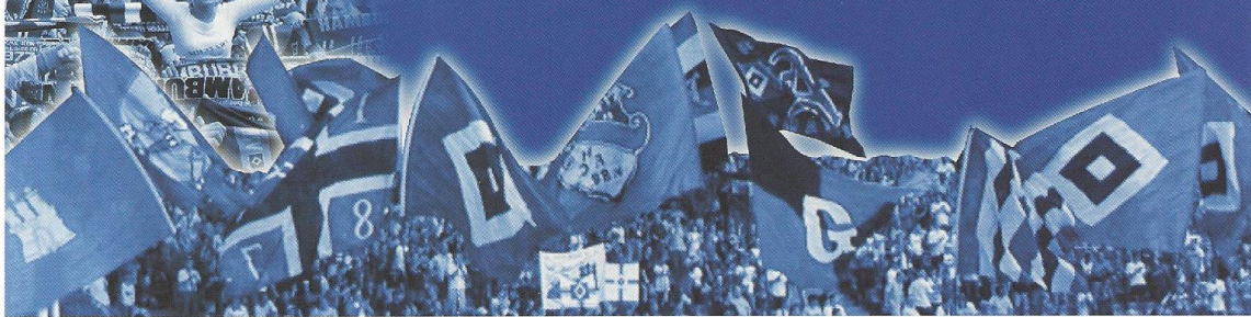
Fanbetreuung Hamburger Sport-Verein